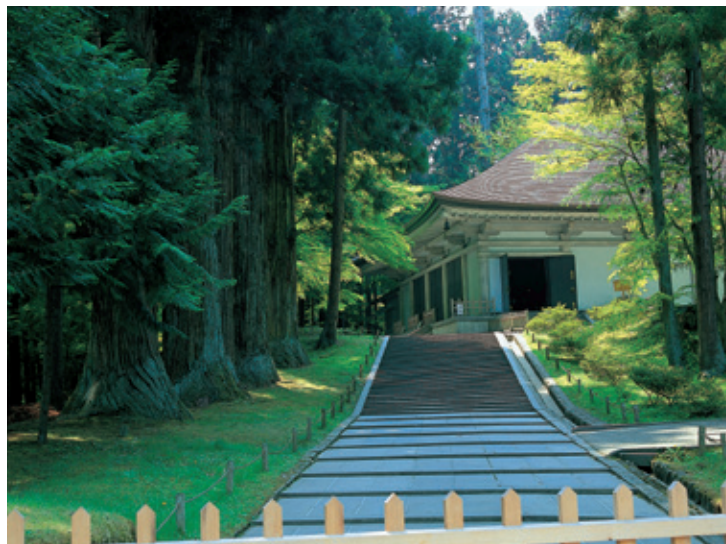
〈平泉〉中尊寺 平成23年6月26日 世界文化遺産に認定

TEL：019-621-6294, 6491 / FAX：019-621-6892 / E-mail：sangaku@iwate-u.ac.jp