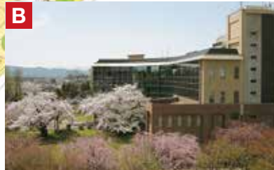
B 岩手大学情報メディアセンター 図書館 二階の専用教室が通常の講義会場となります。