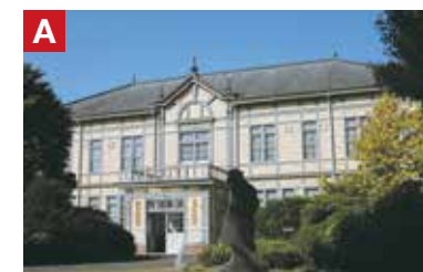
A 農業教育資料館 旧盛岡高等農林学校時代の本館です。