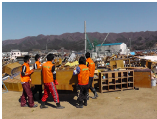
学生ボランティアによるがれきの撤去作業

本学は、震災直後から掲げる「『岩手の復興と再生に』オール岩大パワーを」のスローガンのもと、岩手県の復興を全力でバックアップしていきますので、理解、ご協力をお願いします。