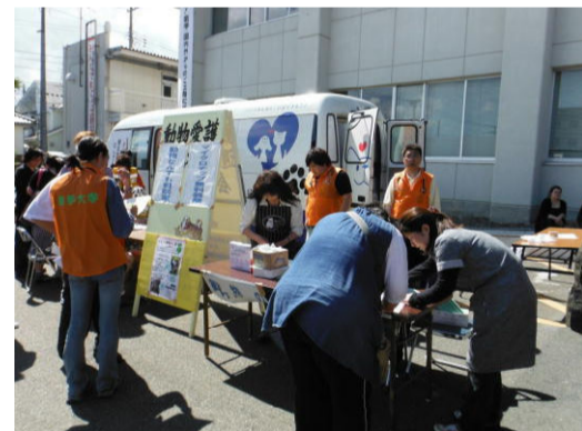
動物何でも相談会の活動状況