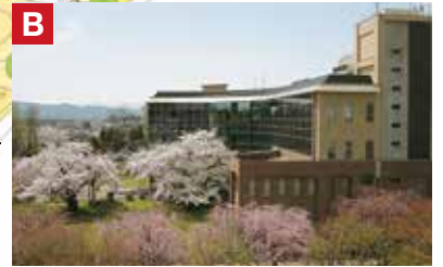
岩手大学図書館 二階の専用教室が通常の講義会場となります。