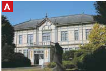
農業教育資料館 旧盛岡高等農林学校時代の本館です。