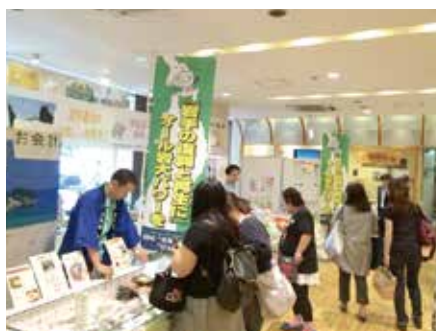
産学官連携で商品化された食品をお客様に説明する共同研究員

震災から5年が経過し、復興支援を一過性のもので終わらせないために、復興に取り組む県内企業や岩手大学の今の姿を、岩手県に関心のある方々に改めてアピールすることができました。