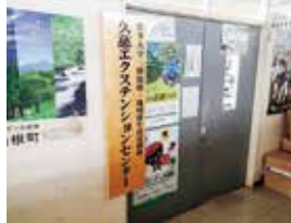
各エクステンションセンター表札の機構名称を変更しました

今年度からは、企業や事業者と実施してきた共同研究案件の進展や新規開始に向けた相談と調整を主業務としつつ、地域連携推進機構との機構統合により、これまでの担当地域外も含めた各機関との連携・協同の活動を一層強化して参りますので、どうぞよろしくお願ひ致します。