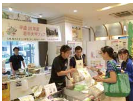
販売しながら、お客様に岩手県の復興状況を説明しました