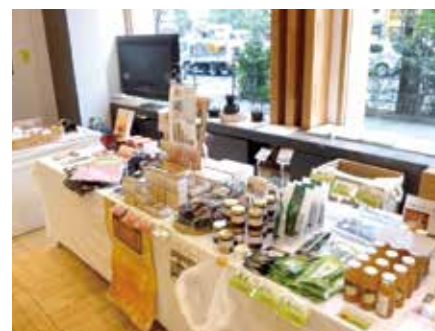
販売した商品の一部