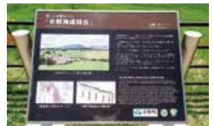
山あいの大野地区なので予想外でしたが、一帯は三陸ジオパークのジオサイトになっています