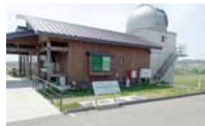
まきば展望台は毎週金、土、日の 13 時～21 時に開館