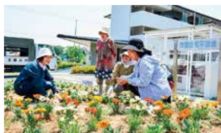
大船渡市災害公営住宅平岡地での花壇整備風景

応急仮設住宅から本設の災害公営住宅へ移転した方々からは、ようやくきれいな住宅へ住めることへの喜びの一方、自立が求められる災害公営住宅への移転に対し、不安に思う声も聞こえてきました。特に「周りの人と話す機会がほとんど無い」など、住民間のコミュニティや地域との関わりが薄いことへの不安の声が多くありました。