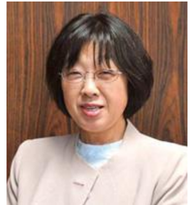
1952年北海道生まれ。北海道大学大学院教育学研究科博士課程修了、博士(教育学)。専攻は社会教育学、農村女性・家族論。福島大学行政政策学類教授。福島県男女共生センター館長、福島大学副学長を歴任

東日本大震災・原発事故から8年8ヶ月が経過しました。原発事故により避難を余儀なくされた自治体は双葉町を除いてすべて避難解除となり、復興に向かって進んでいるように見えますが、未だ県内外に多くの住民が避難を続けています。問題はより複雑化し見えにくくなっています。しかし、困難な状況に立ち向かい復興・再生に向け多様な活動が生まれきたことも確かです。とくに 食と農の再建 を模索する避難 女性農業者 たちの取り組みには目を見張るものがあります。講座では彼ら・彼女らが避難生活から避難解除を経た今日までどのような 学びを重ねてエンパワメント してきたかを、事例を紹介しながら考えたいと思います。