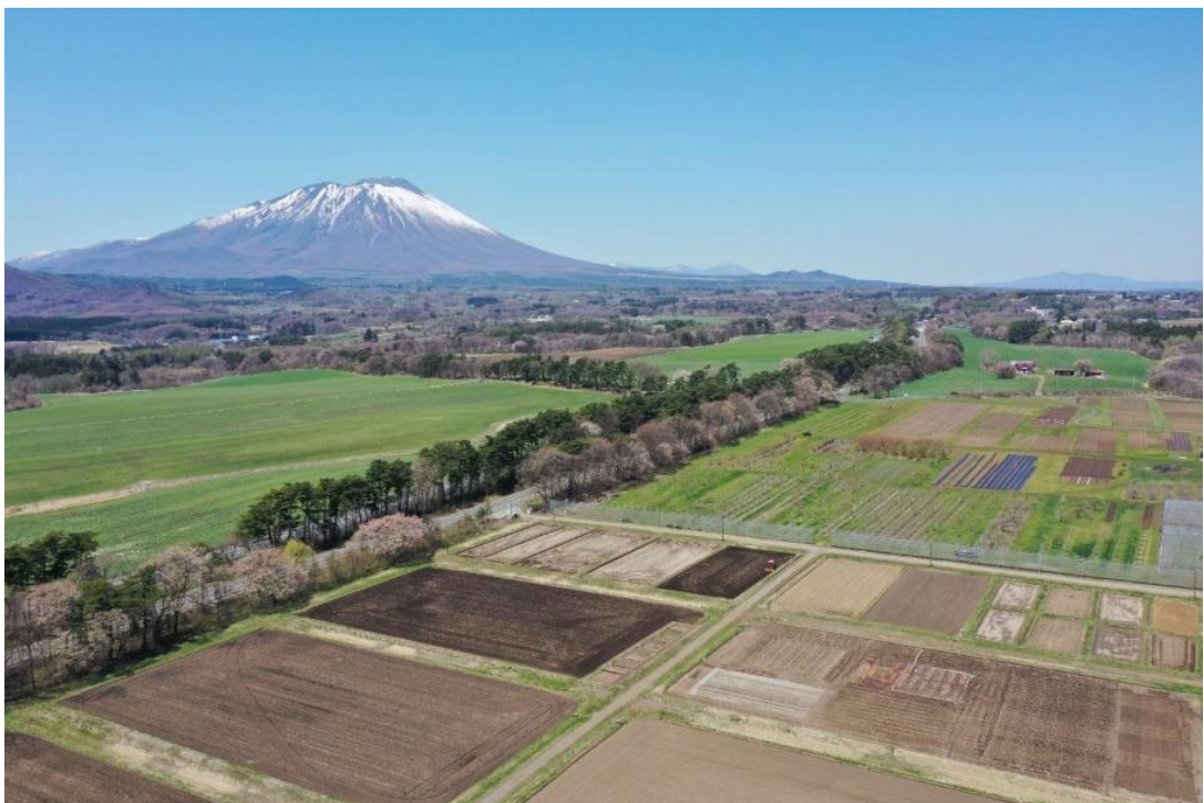
春の滝沢農場（並木の右側）